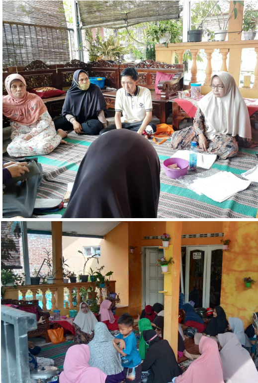
Gambar 6. Foto Kegiatan Pelatihan