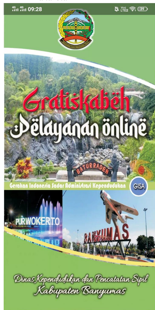
Gambar 2. Tampilan Awal Aplikasi

Tahap implementasi pelatihan dilakukan di rumah pengurus PKK pada hari selasa tanggal 16 Mei 2022 dimulai jam 13.00 sampai dengan jam 15.00 WIB. Jumlah peserta pelatihan Pelatihan diikuti oleh 23 orang pengurus dan anggota PKK. Kegiatan pertama adalah penjelasan tentang aplikasi GRATIS KABEH versi android yang bisa diakses lewat handphone oleh peserta pelatihan. Berikut tampilan aplikasi GRATIS KABEH versi android .