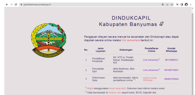
Gambar 5. Tampilan Aplikasi Versi Website

Selanjutnya adalah penjelasan tentang aplikasi GRATIS KABEH versi website. Berikut tampilan aplikasi berbasis website .