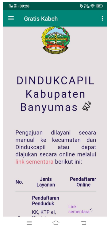
Gambar 3. Tampilan Dashboard Aplikasi Gambar 3 adalah tampilan dashboard aplikasi GRATIS KABEH, di dashboard juga terdapat jenis layanan yang bisa diakses melalui aplikasi ini seperti tampilan pada gambar 4 berikut.