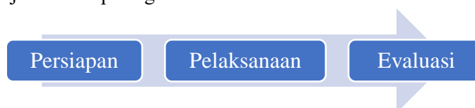
Gambar 1. Tahapan Kegiatan

Metode yang digunakan adalah presentasi, latihan dan tanya jawab. Langkah-langkah kegiatan yang dilakukan dapat dijelaskan seperti gambar di bawah ini.