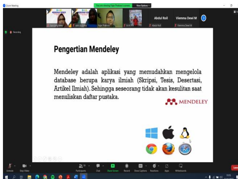
Gambar 3. Penyampaian Materi Terkait Mendeley

Paparan tentang materi pengenalan aplikasi mendeley reference dimulai dengan penyajian materi tentang pengertian mendeley dan juga kelebihanannya. Beberapa kelebihan mendeley diantaranya adalah dapat mendeteksi secara otomatis file yang dimasukkan seperti penulis, halaman, judul, abstrak, jenis file dan lainnya tanpa harus memasukkannya secara manual satu per satu persatu. Penulis dapat menyesuaikan tulisan karena dapat diedit, Memudahkan penulis untuk mengakses kapanpun dan dimanapun karena mendeley terhubung lewat website, tiap karya ilmiah yang diupload secara otomatis akan berurutan sehingga penulis tidak perlu mengurutkan secara manual satu persatu.