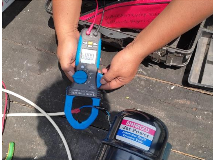
Gambar 11. Pengukuran Beban Listrik Sistem Pompa Air dengan Tenaga Surya

Masing-masing komponen PLTS dicek dengan mengukur input dan atau input-nya, mulai dari PV, inverter dan baterai untuk memastikan semua komponen berfungsi sesuai dengan spesifikasinya.