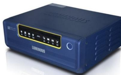
Gambar 7. Inverter 1100 VA pure sine

Inverter berfungsi untuk mengubah listrik arus searah (DC) menjadi listrik arus bolak balik (AC) dengan besaran tegangan dan frekuensi yang dapat diatur (Mundus, Khwee, & Hiendro, 2019). Inverter dalam sistem pompa air tenaga surya ini, digunakan untuk mengubah listrik DC output dari PV menjadi listrik AC yang akan digunakan untuk menjalankan pompa air. Inverter yang digunakan merupakan inverter tipe sine wave yang memiliki kapasitas daya 1100 VA, dengan tegangan input 12 Vdc dan tegangan output 220 Vac serta frekuensi 50 Hz.