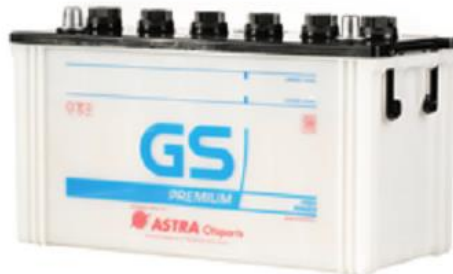
Gambar 8. Baterai 100 Ah

Baterai adalah alat yang digunakan untuk menyimpan energi listrik dalam bentuk kimia kemudian diubah menjadi energi listrik (Nasution, 2021). Pada sistem ini baterai digunakan untuk menyimpan energi listrik output dari PV yang sudah diubah menjadi listrik DC, agar bisa digunakan untuk menjalankan pompa air pada saat malam hari atau pada saat intensitas cahaya matahari berkurang. Baterai yang digunakan pada sistem ini memiliki spesifikasi tegangan 12 V dan kapasitas 100Ah