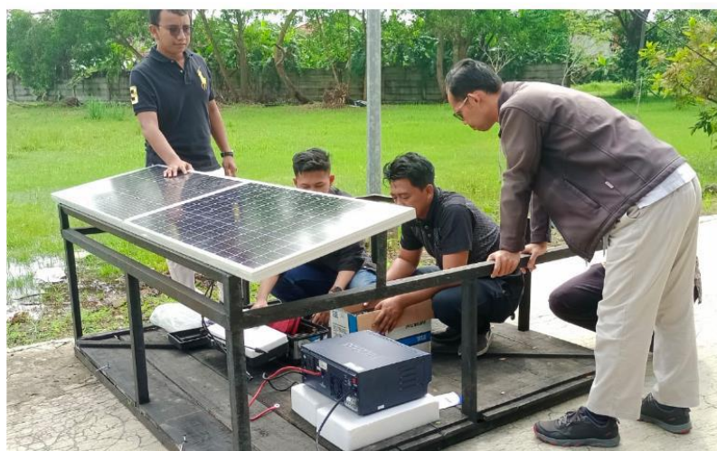
Gambar 10. Uji Coba Instalasi PLTS

Uji coba instalasi sistem PLTS untuk pompa air dilakukan di kampus Politeknik Negeri Cilacap. Uji coba dilakukan untuk memastikan sistem PLTS dapat berfungsi dengan baik dan dapat menjalankan pompa air, sebelum dipasang di lokasi yang telah ditentukan.