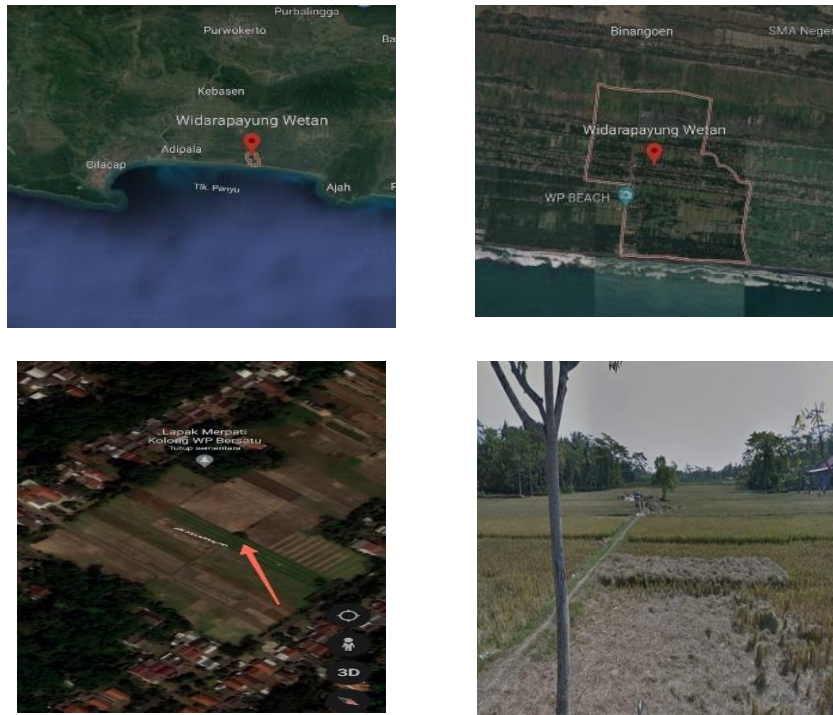
Gambar 3. Lokasi Pemasangan Pompa Air Tenaga Surya di Desa Widarapayung Wetan