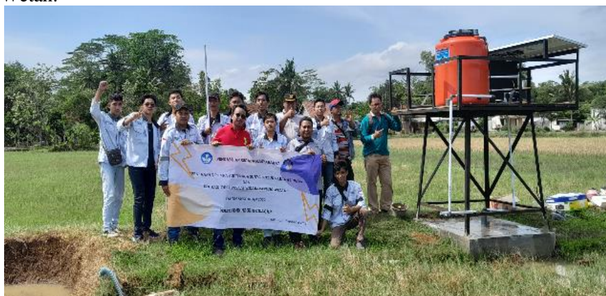
Gambar 15. Penutupan Kegiatan Pengabdian di Desa Widarapyung Wetan

Setelah pelaksanaan pelatihan, kemudian dilaksanakan acara penutupan dan serah terima sistem pompa air tenaga surya dari tim pengabdian kepada masyarakat Politeknik Negeri Cilacap kepada Desa Widarapyung Wetan.