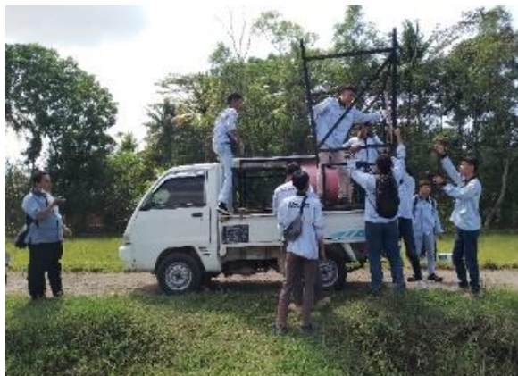
Gambar 12. Instalasi Pompa Air Tenaga Surya di Desa Widarapayung Wetan