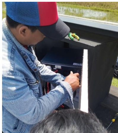
Gambar 14. Pelatihan Operasional dan Perawatan Pompa Air Tenaga Surya

Hasil uji coba pompa air tenaga surya ini didapatkan kapasitas pompa air sebesar 30 liter/menit. Setelah dipastikan bekerja dengan baik, tahap berikutnya adalah pelatihan operasional dan maintenance . Materi-materi yang disampaikan antara lain; teori dasar kelistrikan, pengukuran listrik, sistem PLTS dan troubleshooting pompa air. Pelatihan dilaksanakan langsung dilokasi pompa air tenaga surya dengan metode praktek langsung.