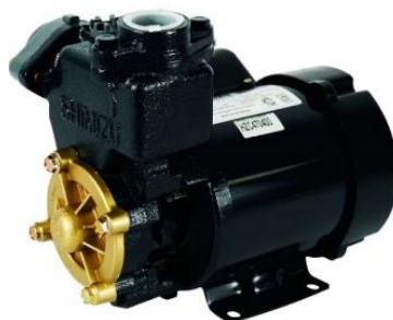
Gambar 9. Pompa Air

Pompa air yang digunakan dalam sistem ini memiliki spesifikasi daya sebesar 125 watt dengan tegangan input 220 Vac. Sumber energi listrik untuk menjalankan pompa air berasal dari output PV yang sudah diubah menjadi listrik AC oleh inverter.