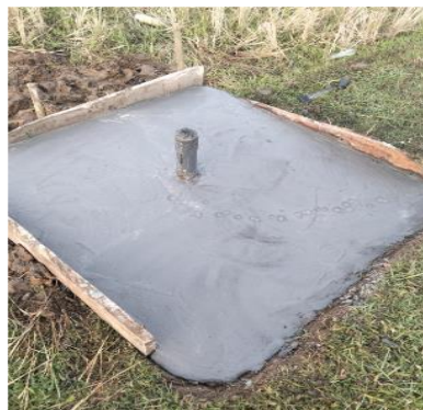
Gambar 4. Sumur Bor sebagai Sumber Air Sistem Pompa Air Tenaga Surya