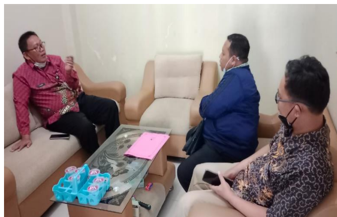
Gambar 2. Kegiatan Kordinasi Tim Pelaksana PkM dengan Perangkat Desa

Kordinasi dilakukan antara tim pengabdian dengan perangkat Desa Widarapayung dan masyarakat calon operator atau pengelola pompa air tenaga surya.