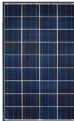
Gambar 6. Photovoltaic 100 Wp

Photovoltaic yang digunakan berupa photovoltaic polycrystalline yang termasuk tipe crystalline dengan kapasitas 100 Wp dan tegangan output 18 V. Tipe crystalline merupakan generasi pertama sel surya dan yang paling banyak digunakan oleh masyarakat. PV tipe crystalline terdiri dari jenis monocrystalline yang memiliki efisiensi rata-rata sebesar 19% dan jenis polycrystalline yang hanya memiliki efisiensi rata-rata sebesar 18% (Anggara & Saputra, 2023). Sistem ini menggunakan 2 buah photovoltaic yang dirangkai paralel.