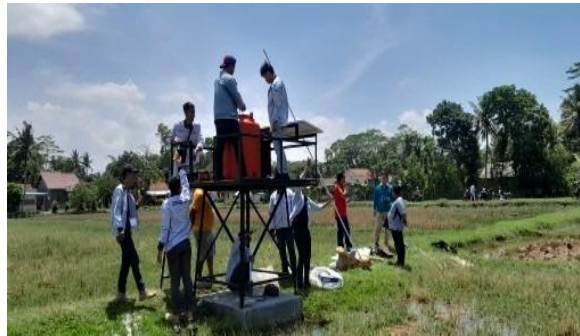
Gambar 13. Uji Coba Operasional Pompa Air Tenaga Surya

Uji coba operasional pompa air tenaga surya dilaksanakan setelah kegiatan instalasi. Ujicoba dilaksanakan untuk memastikan sistem pompa air tenaga surya bisa bekerja dengan baik.