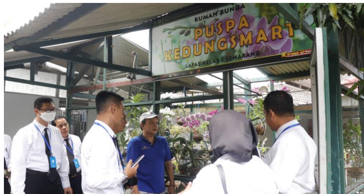
Gambar 2. Puspa Kedungsmart Sebagai Program Pembinaan Keterampilan Agribisnis

penggunaan produk-produk buatan dalam negeri serta dukungan terhadap produk usaha mikro, kecil, dan koperasi