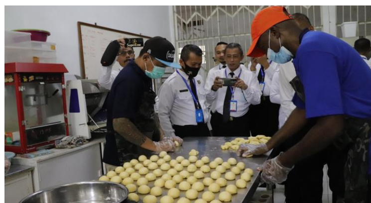
Gambar 3. Sentra Produksi Roti Dalam Program Pembinaan Keterampilan Kuliner